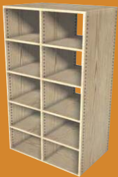
■ ESEMPIO DI LAVORAZIONE WORKING EXAMPLE